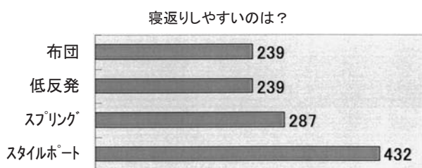
図2 寝返りしやすさのアンケート結果

わせてオーダーメイドできるような寝具です。そのコンセプトのもとに、肩・腰・お尻などの部分ごとに硬さを調節することができるセミオーダータイプのマットレスを開発し2003年5月より販売しております。7分割されたミドルレイヤーごとに3種類の硬さを選択できるので、 3^7=2187 種類から使用者にあったものを選ぶことができます（図1）。